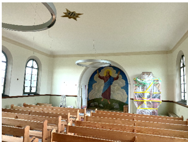
Bild: Stand der Arbeiten 10. Dezember

Unser Dank geht an alle beteiligten Unternehmen (Malerei Bär, Buholzer Innenausbau, Elektro Rüthemann). Zudem an das Amt für Denkmalpflege für die Begleitung der Arbeiten und die Beitragszusicherung.